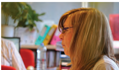
Un chef de projet unique pour sécuriser la prestation.